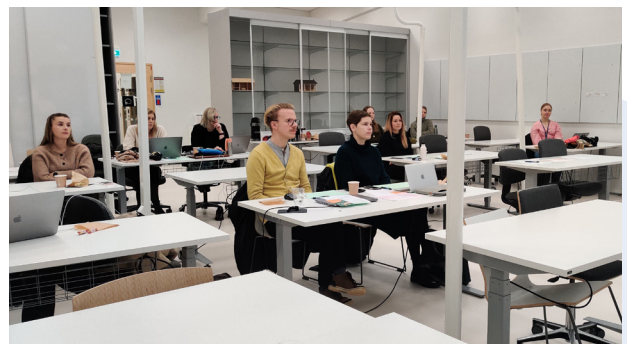
Sissari 2.0 -koulutuspilottissa on mukana mahtava, utelias, tiedonjanoinen ja aktiivinen porukka, jonka kanssa jatketaan heti tammikuun alussa kestävän kehityksen teemaan.