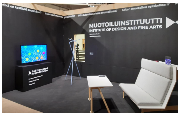
Habitaren osastolla oli hankkeiden lisäksi esillä Muotoilu-instituutin opiskelijoiden suunnittelema huonekaluja.