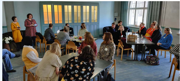
Tunnelmia Business Design Bootcampiltä.