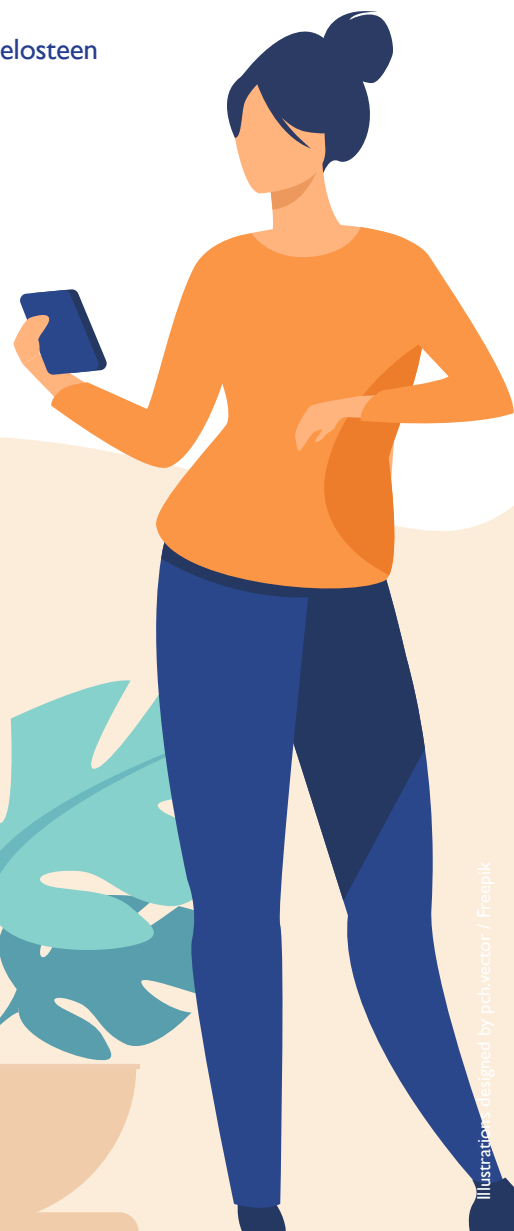
Illustration designed by pchvector / Freepik